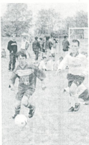
Il y a de l'émulation dans l'air !

donnée VTT de 23 km (avec son vélo et son casque). Inscriptions au 02 31 77 93 79. A 9 h, près de l'école de la Meauffe, débutera une randonnée équestre de 12 km (venir avec sa monture et être assuré). Inscriptions au 02 33 56 78 84. A partir de 13 h 15, après s'être donné rendez-vous au parking de l'école de la Meauffe, est organisée une descente en canoë-kayak sur la Vire. Inscriptions au 02 33 57 10 25, 06 82 18 48 23 ou 03 61 19 77 53. Le midi, grillades et boissons à la Meauffe et le soir, repas du terroir animé par le groupe Folkie Vire (repas sur réservation et toutes informations complémentaires au 02 33 77 42 22).