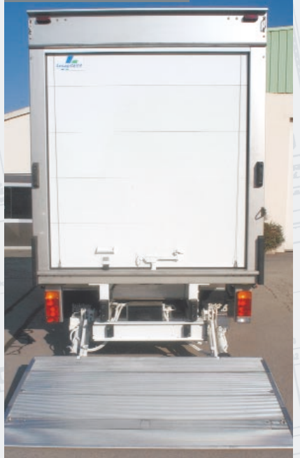
Cadre rideau isotherme