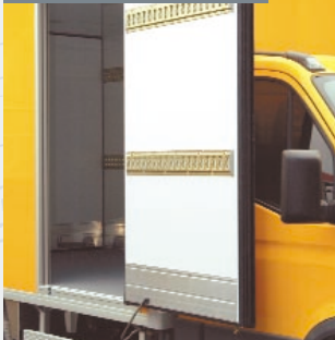
Porte latérale simple