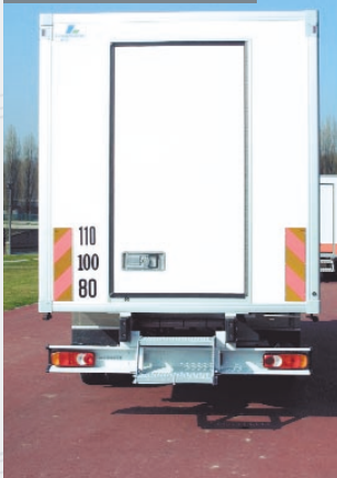
Porte arrière simple