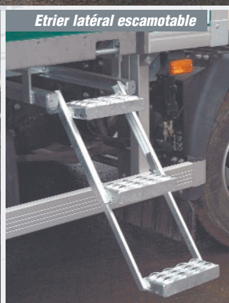
Etrier latéral escamotable