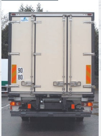
Cadre 3 vantaux inox