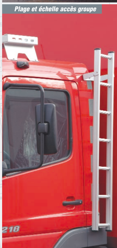
Plage et échelle accès groupe