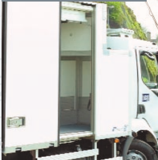
Porte latérale coulissante