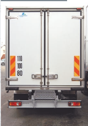
Cadre 2 vantaux alu