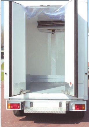
Porte arrière double